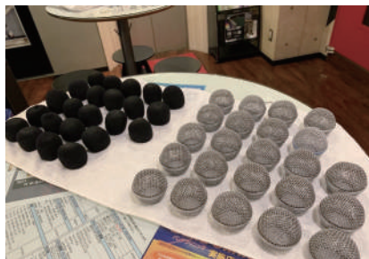
定期的にマイク（グリル）の 洗浄、消毒を行っています