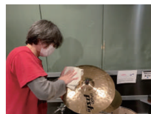
常設機材の除菌清掃