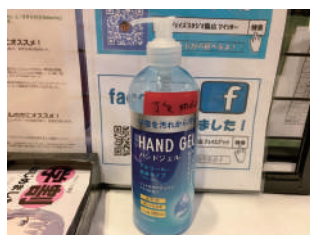
消毒用アルコールを常備