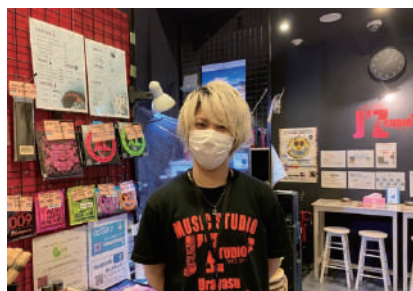
スタッフのマスク着用