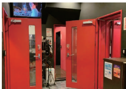
お客様入室前の スタジオ内換気を徹底