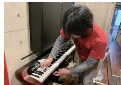
レンタル機材の除菌清掃